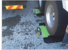
写真－２ 無線式移動台貫