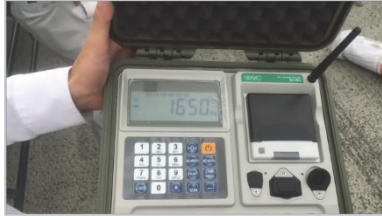
写真－１ 無線式移動台貫

粉粒体運搬車からアジテータ車へのプレミックス材供給量は、無線式移動台貫（写真－１、写真－２）を用いて管理し、散水車からの混練水供給量は、水中ポンプに連動した水量計（写真－３）にて管理している。これにより、安定した品質の注入ミルク材を製造することが可能である。