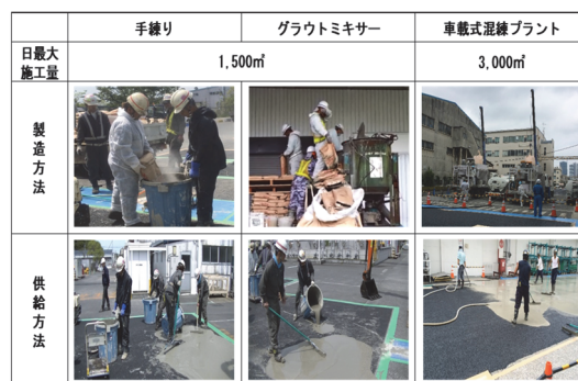
図-1 主な製造・供給方法

図-1に加え、アジテータ車を用いた製造・供給方法として生コンプラントで製造した注入ミルク材を、アジテータ車にて運搬、供給する方法もある。本方法は、生産性向上策の一つといえるが、運搬距離による材料使用時間の限界等が課題であると考えられる。