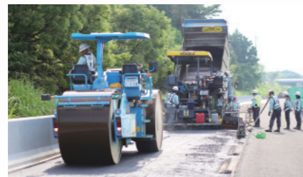
アスファルト舗装の様子

建設業界は他産業に比べ労働時間が長いという理由等から、若年層に敬遠される業界のひとつとなり、これにより従事者の高齢化や慢性的な人手不足が生じています。まさに「働き方」について見直しを迫られている状況にあります。そのような中、当工事事務所ではダイバーシティ人材を活用した働き方改革に取り組んでいます。土木工事の現場事務所としては女性の比率も高く(24人中10人が女性)、外国籍の女性土木技術者など多様な人材を活用しています。その中で働き方改革を推進するために、誰もが働きやすい魅力的な職場づくりや異なるバックグラウンドを持つ従業員同士のコミュニケーションの円滑化、現場の書類作成業務の分業による時間外労働の削減に重点的に取り組んでいます。