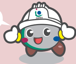
NIPPO マスコットキャラクター ミッチーくん