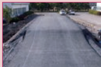
HRB工法 アスファルト舗装が滑らかに変形