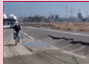
東日本大震災時、舗装に段差が生じ自動車の通行が不能に

当社では、平成23年1月、東日本大震災の発生前に、 地震対策型段差抑制工法「HRB工法」 を産学連携共同研究により開発しました。地震によって地盤が沈下しても、舗装下部にある碎石の層にサンドイッチ状に敷いた特殊シート「ジオグリッド」と、それを締め付ける