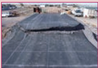
一般工法 亀裂や段差が発生し、車両通行不可

「拘束部材」による効果で、舗装表面が滑らかに変形した状態にとどまる他、亀裂や段差の発生を抑制するため、地震直後でも緊急車両等の通行を可能にします。