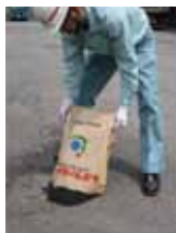
開封しそのまま均す