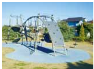
遊具下での使用例