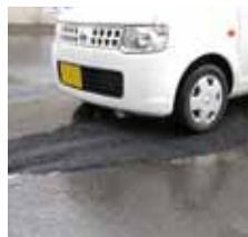
タイヤで踏めば完了