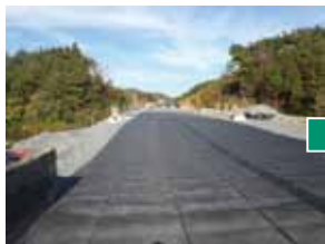
ジオグリッド敷設後

2012年4月に開通した常磐自動車道 相馬舗装工事（福島県南相馬市）では、1,312㎡にわたって、カルバート（暗きよ）や橋梁前後の段差抑制対策として採用されています。