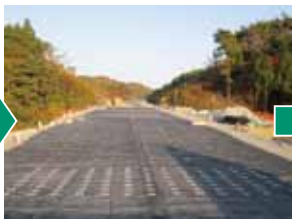
拘束アンカー打込み後