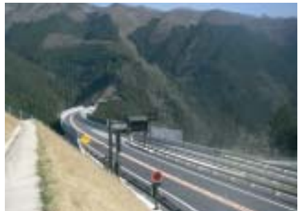
施工例：志戸坂峠道路(鳥取県智頭町)

凍結路面になりにくい 圧雪・氷盤が剥がれやすい 凍結抑制効果が長時間維持される グレーダ等による除雪作業での破損が少ない 併用後の耐久性が安定している 一般舗装と同等の耐久性がある