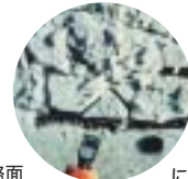
圧雪・氷盤が簡単に剥がれる