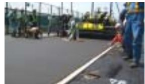
コークミックスの施工状況

ほどよい弾性を持ちながらスピード感のあるゲムができるので、国際的な大会のメインコートにも用いられる