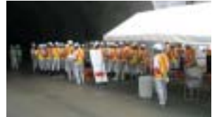
国土交通省・愛媛県を対象に行われた見学会

愛媛県宇和島市の新松尾トンネル内舗装工事では、全幅(W=9.4m)を1回で(2車線同時施工)しかも1層敷均して施工しました。