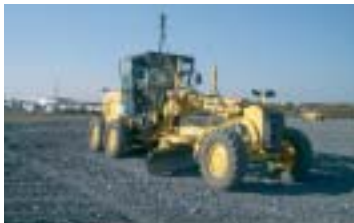
民間大型駐車場工事（路盤工）