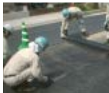
ガラスグリッドの敷設