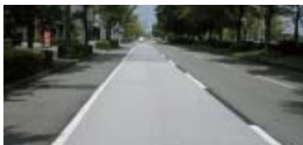
「パーフェクトクールEM」の車道への適用例