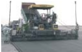
関西空港2期工事（基層工）