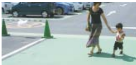
「パーフェクトクールA」の屋上駐車場への適用例

すえ切りに対して優れた抵抗性があり、小粒径骨材により均一な美しいきめが得られます。