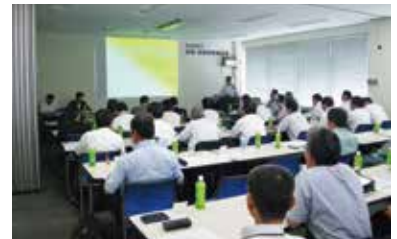
第6回改良・改善事例報告会の様子

「確かなものづくり」を具体化するために、現場における改良点・改善点を考える習慣を身につけるとともに、生産性向上を図ることを目的に、2012年7月に開催しました。全国の応募から選定された20編が本社にて報告されました。