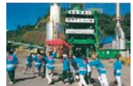
愛媛県今治市玉川町與和木での秋祭り

当社は、スポーツ、学術・研究をはじめ国際交流等の寄付を通じて、社会の期待に応えています。また、全国400以上の事業所では、地域の祭礼や町内会・子供会等の交通安全、防犯活動等のイベントに従業員が積極的に参加するとともに、多くの事業所で、独自の清掃・環境整備活動を自主的に実施しています。