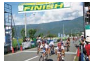
ツール・ド・北海道への協賛・参加

このほか、剣道部は各種大会で連続入賞、テニス部は関東実業団や全国実業団へ駒を進めるなどの活躍を通じて、スポーツ振興に取り組んでいます。