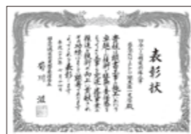
四谷(2)舗装修繕工事で国土交通省関東地方整備局長からいただいた表彰状

施工担当者は、厳格な品質管理を行い、お客様に品質の高い製品を供給する体制を整えています。施工の各段階での品質検査、結果の整理・確認を行い、不良原因の早期発見・排除を進め、品質の確保に努めています。また、事前に社内での完成検査を行い、引き渡しをできる状態か厳重なチェックをした上で、お客様の完成検査を受けています。