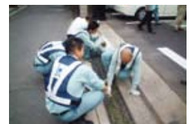
大阪出張所での清掃活動