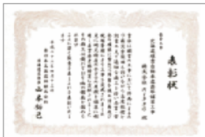
北海道縦貫道路部舗装工事で、東日本高速道路北海道支社から施工中の創意工夫などが評価され、いただいた表彰状

施工担当者は、お客様に高い品質の製品を供給するため、厳格な品質管理を行っています。施工の各段階での品質検査や結果の整理・確認により、不良原因の早期発見・排除を進め、品質の確保に努めています。また、お客様の完成検査を受ける前の社内での完成検査により、引き渡しできる状態かどうかを厳重にチェックしています。