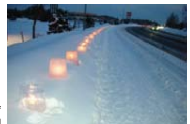
北海道試験所で「キャンドルナイト」に参加