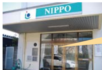
子どもたちを犯罪や事件から守るための活動「こども110番」(新潟県内の常設事業所すべてで開設)

当社は、スポーツ、学術・研究をはじめ国際交流等の寄付を通じて、社会の期待に応えています。また、全国400以上の事業所では、地域の祭礼や町内会・子ども会等の交通安全、防犯活動等のイベントに従業員が積極的に参加するとともに、多くの事業所で、独自の清掃・環境整備活動を自主的に実施しています。