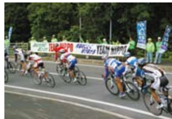
ツールド北海道へ協賛・参戦

は、旭川市をスタートして5日間で延べ705kmを走破し、当社チームは団体総合6位の成績を収めました。2008年には、当社の長年の運営協力に対し、財団法人ツールド・北海道協会より感謝状をいただきました。このほか、ツアーオブ・ジャパン、ジャパンカップサイクルロードレース等、シーズンを通じて数々の大会へも参戦し、自転車競技の振興をお手伝いしています。