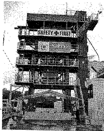
製造能力毎時150tの中規模プラントを建設

（政府開発援助）工事を施工している。海外事業はグアム、ODA、日系企業関連、東南アジアを主体とする遮熱塗料の販売の4つを柱に展開する。